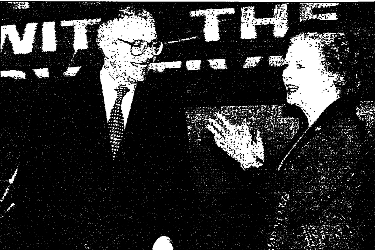
رئيسة الحكومة البريطانية السابقة مارغريت تاتشر تتصق لخلها جون ميون خلال اجتماع نظم أس في مركز حزب المحافظين بستان حذر من مشروع خفض لعضوية مجلس لعموم

تقوم السلطات في بنغلادش بحملة للبحث عن منشدين إسلاميين مجهولين تقول صحيفة انهم مختبئون في غابات كثيفة. وقالت صحيفة جاناكتا، اليومية ان معاجمهم منجنج بالسلاح اختبأوا في الغابات بمنطقة بنديرايان في تشيتاغونغ هيل تراكتس ويبرون شاملاً بظواهرهم باتهم طلاب. ويشاربان من ثلاثة اسابيع في جبل تراكتس، حيث يشن فور شاشي باهيني الجنود حملة تدمر منذ عام 1973. وفي أكثر من 8000 من الثوار والقوات الحكومية والجندي حثهم في التمر الذي يصدف في دعم مطالب شاشي باهيني بالحصول على الحكم الذاتي لمنطقة هيل تراكتس للتخمس ليوهورا. وقال مسؤول لروبير السبوت ولكن ليس لهيئة تقرير رسمي عن الخشيء مجاهدين مسلحين حالياً بالمنطقة. وقال تقرير صحيفة جاناكتا ان المقاتلين المختبئين في منطقة نياهاجتشاشري في بنديرايان ربما كانوا على صلة بحركة طالبان في أفغانستان. وأضاف التقرير ان بجونتهم أسلحة حديثة.